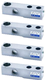
4 sensores de peso